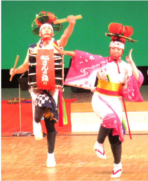
華やかで迫力のある踊り

盛岡市本宮一丁目7番27号 電話 019-631-1707 FAX 019-631-1706 教宣部・青年部