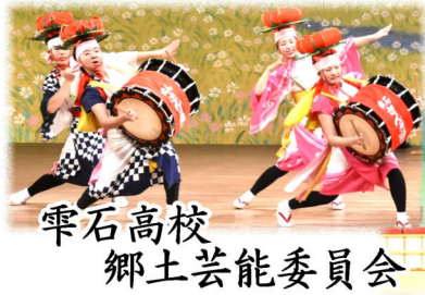
雫石高校 郷土芸能委員会