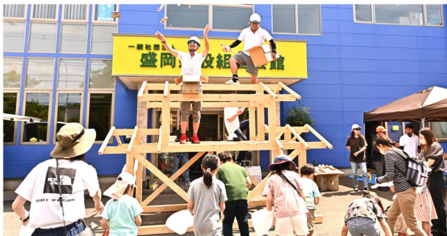
組合前青年部会場でのお菓子まき

組合前青年部会場では、今年4年ぶりに開催されました。朝から各会場ではテントを貼るなどの準備を始め、西・北・県北グループでは、本棚などの木工体験、プランターや置き物などの木工品販売、刃物研ぎ等、たくさんのお客様が参加されました。青年部の会場では焼き鳥や駄菓子、上棟式でお菓子まきもありました。住宅相談が以前より