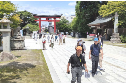
暑い日差しの下ウォーキング

暑い日差しの下ウォーキング。学しながら静かな雰囲気の中で散策することができました。ウォーキングの後は「初駒本店」でわんこそばを頂きました。子どもも大人も笑顔でわんこそばを楽しみました。「無理はないでね」とお店の人に声を掛