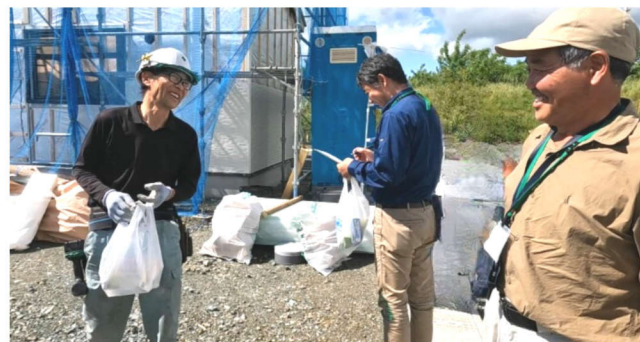
足場を頼りに現場を訪問