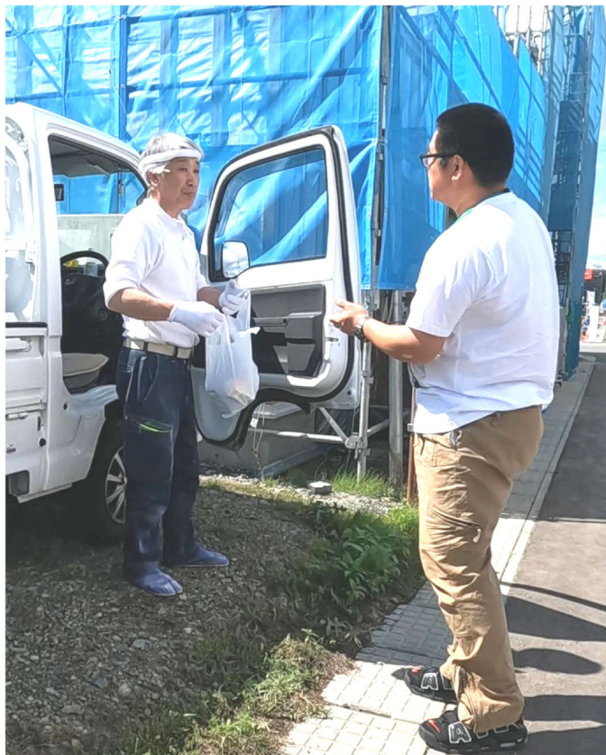
現場の職人さんに組合の宣伝

盛岡市本宮一丁目7番27号 電話 019-631-1707 FAX 019-631-1706 教宣部・青年部