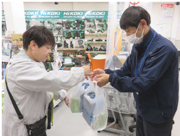
道具屋さんにもアピール

盛岡建設労働組合の組織対策部では、組織の維持ならびに新規加入者の加入促進を目的に前期と後期で組織拡大行動を実施しています。今回は前期として6月3日(土)に組合長を含む役員4人、組織部長3人、青年部3人、主婦の会2人、事務局1名の計13人で組織拡大行動を実施しました。内容は工事現場の作業者へ組合オリジナルボックスステッカー、お茶やジュース、組合パンフレット等を差し上げて組合の概要を伝え、他の建設業従事者への紹介もお願いしました。実施結果53件の工事現場や工具等販売店舗へ訪問をし、84人の方々と対面することができました。