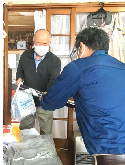
作業着屋さんにポスターを配布

当日は朝8時半に組合事務所集合し、現場や販売店を訪問しました。内容は工事現場の作業者へ組合オリジナルボックスステッカー、お茶やジュース、組合パンフレット等を差し上げて組合の概要を伝え、他の建設業従事者への紹介もお願いしました。