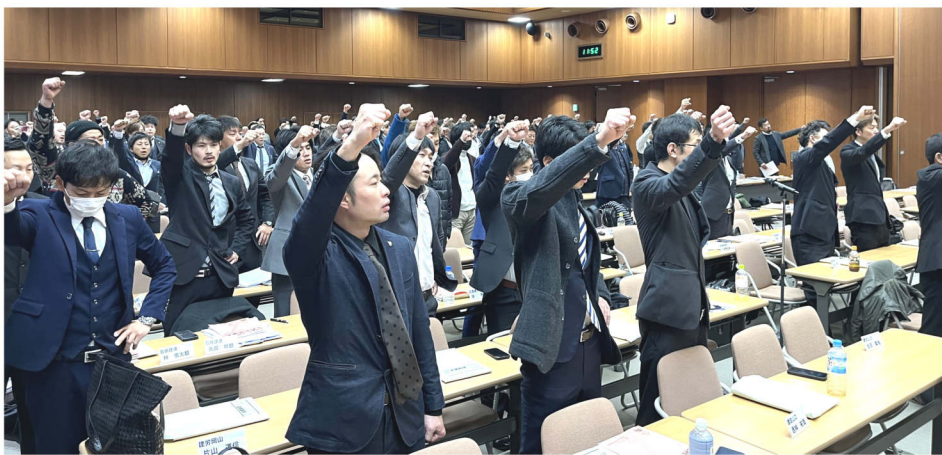
最後は176名で団結ガンバロウ

2月11日、12日に東京都「連合会館」にて第63回全国青協定期大会（全建総連全国青年部協議会）が開催されました。岩手県連・組合から6名、会場には48県連・組合から計176名が参加しました。1日目は、令和6年能登半島地震の被災地域の北信越青協から被害状況の報告があり、協議長より挨拶、勝野