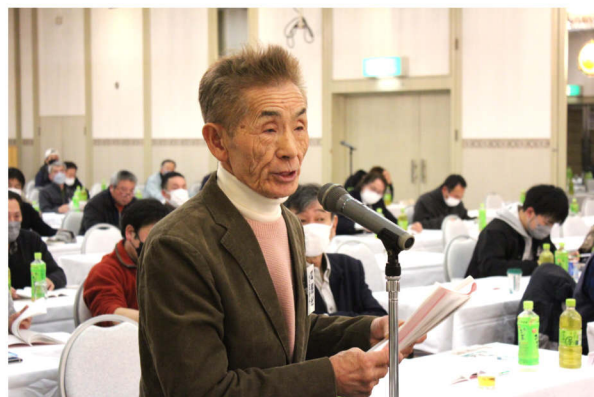
質問をする上米内分会上関分会長

議事から「これからを担う青年部の予算を増額してはどうか」という発言があり「10万円増額している。それ以上は対応する旨を部長に伝えていく」との回答がありました。