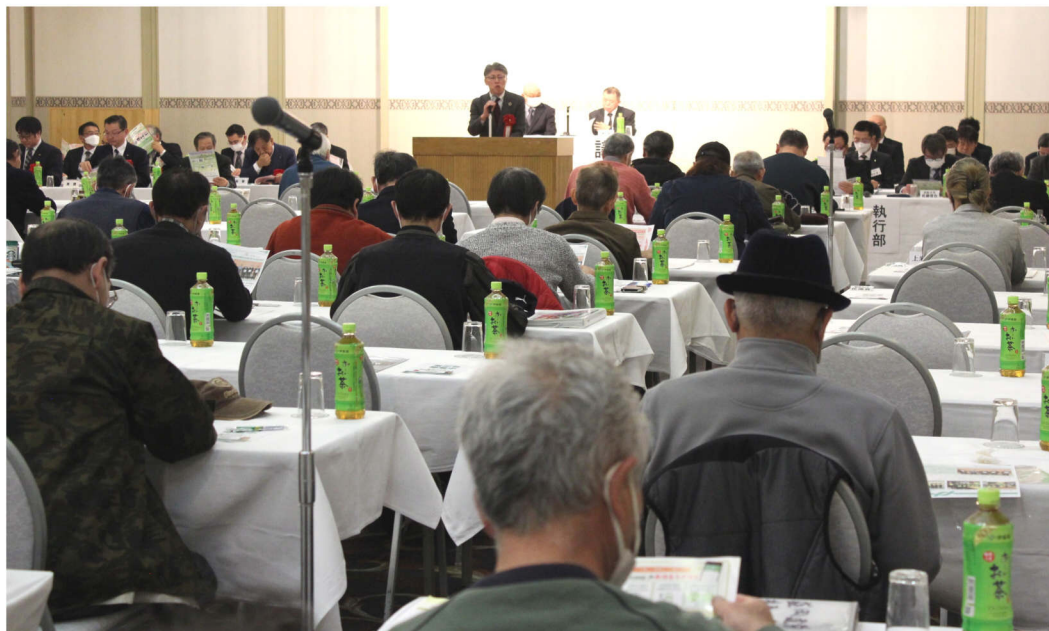
サンセール盛岡で開催された定期大会

盛岡建設労働組合 盛岡市本宮一丁目7番27号 電話 019-631-1707 FAX 019-631-1706 教宣部・青年部